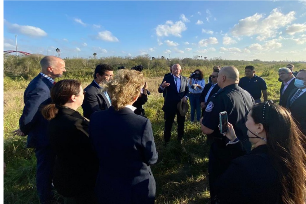
Presentación del proyecto del parque binacional de Matamoros-Brownsville ante el embajador de EUA en México (Brownsville, febrero 2022)

como referencia este paseo para repensar el río Bravo / Grande; de hecho, esta idea ha guiado a Matamoros-Brownsville desde los años 1990. En ambos lugares, las autoridades señalan el carácter transfronterizo / binacional como un valor añadido respecto al paseo de San Antonio. Sin embargo, más allá de esta representación, lo transfronterizo / binacional constituye un obstáculo a resolver.