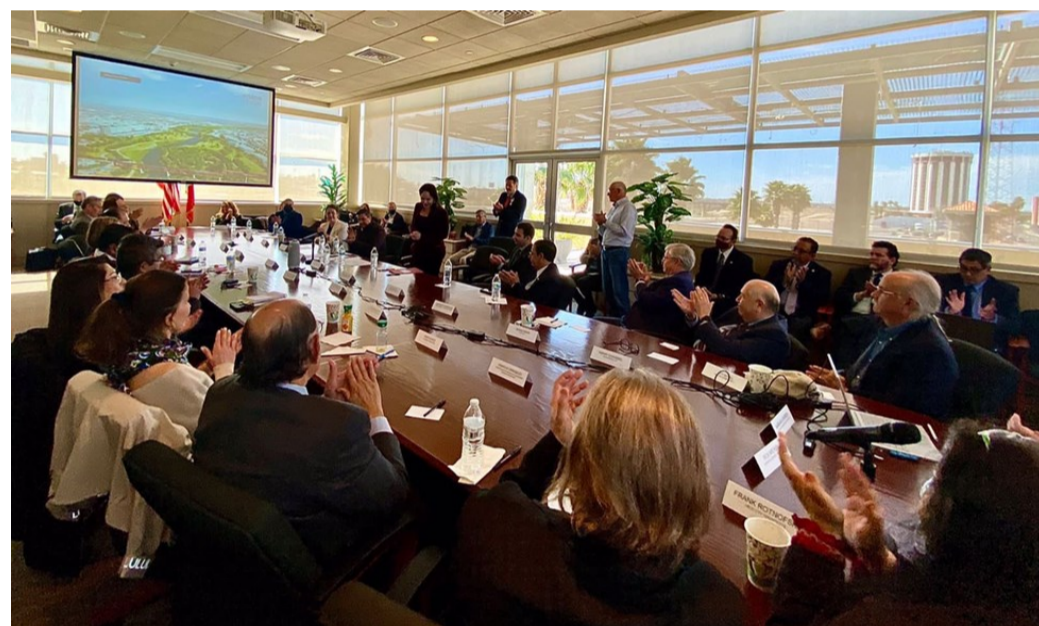
Presentación del proyecto del parque binacional de los Dos Laredos ante el embajador de EUA en México (Laredo, febrero 2022)

El proyecto se ha pensado como de largo plazo y de desarrollo por etapas. En esta dirección, una de las acciones previas y prioritarias en Nuevo Laredo es la reducción de las aguas residuales vertidas al río. Para ello, en febrero de 2022 se firmó un convenio interinstitucional para el financiamiento, ampliación y mejoramiento de los sistemas de drenaje sanitario y de las 2 plantas de tratamiento (Internacional y Noroeste) de la ciudad. En el convenio participan el Banco de Desarrollo de América del Norte (NADBank), la Comisión Municipal de Agua Potable y Alcantarillado (COMAPA) de Nuevo Laredo, la Comisión Estatal del Agua de Tamaulipas (CEAT) y la Comisión Nacional del Agua (CONAGUA).