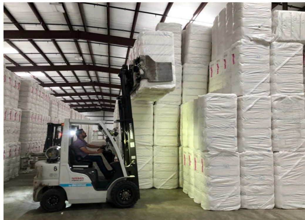
Nuevo almacén de algodón de Commodities Integrated Logistics (CIL) Group en Weslaco (octubre 2019)

Más recientemente, en 2022, Weslaco también ha obtenido la designación como “puerto libre” ( freeport ), regulado por la norma fiscal “ Freeport and Goods in Transit Exemptions ”, que permite la exención de impuestos sobre bienes y productos industriales producidos y almacenados que se exporten fuera de Texas en menos de 175 días. La iniciativa surgió de la Weslaco Economic Development Corporation (WEDC), a la que se sumaron los 3 gobiernos locales de la ciudad, que progresivamente aprobaron la exención de impuestos: City of Weslaco (2021), County of Hidalgo (2021) y Weslaco Independent School District (enero de 2022).