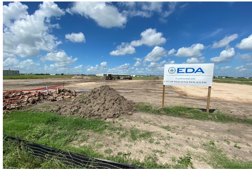
Obras de ampliación del Mid Valley Airport, Weslaco (agosto 2021)

los próximos 5-10 años, se prevé ampliar de nuevo la pista (a 7,500 ft / 2,286 m) y la plataforma de estacionamiento, con el fin de captar aviones de mayores dimensiones y de mayor distancia destino/origen. El presupuesto de este proyecto es de 13M de dólares.