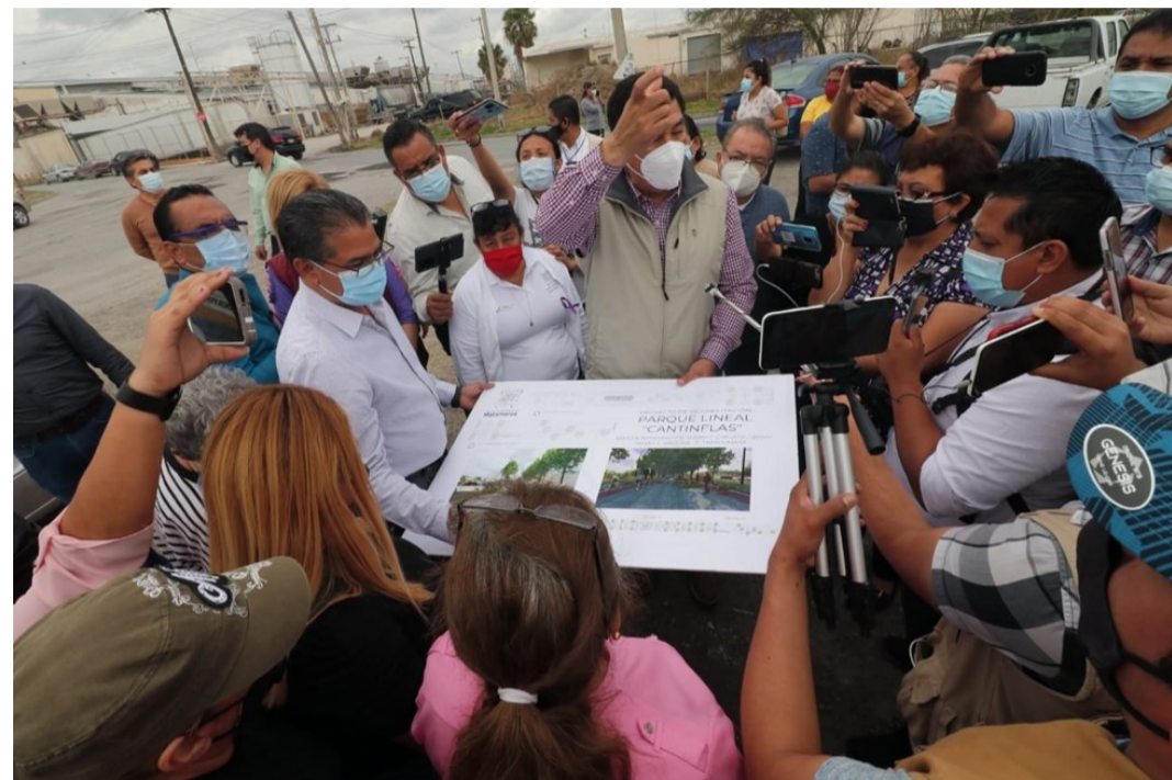
Presentación del proyecto de ciclovía y vitapista a los representantes de colonia por el alcalde de Matamoros y el Secretario de Desarrollo Urbano y Ecología (marzo 2021)

en la 2ª, la ciclovía y la vitapista, entre las calles Arizona y Tarahumara, con una longitud 1.2 km (600 m por sentido). En ambos extremos el Ayuntamiento colocó paneles de madera con la leyenda "Vive. Ruta verde, pasea seguro".