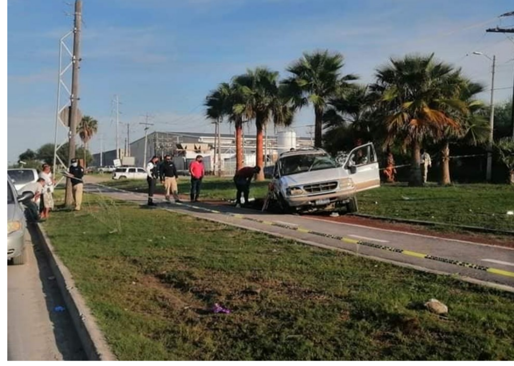
Accidente automovilístico en la ciclovia y vitapista del parque lineal Cantinflas (septiembre 2021)

de Matamoras reclaman además una mayor cultura vial a los automovilistas y a la administración pública, para garantizar un mayor respeto a los peatones y ciclistas, dado que son los usuarios más vulnerables.