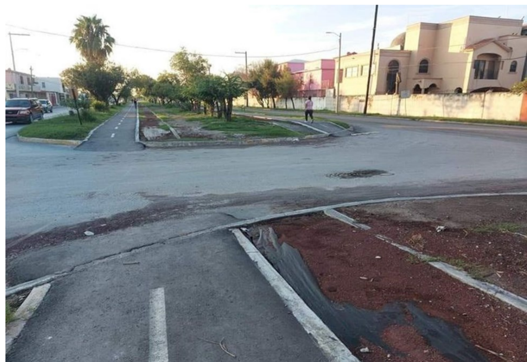
El parque lineal, segmentado por un retorno de la avenida Cantinflas (altura calle Pirules) (octubre 2021)

Los paneles han resultado ser muy irónicos. En el tramo del parque, la avenida es una vialidad sin obstáculos, completamente recta y, además, recientemente reencarpetada (en 2018, en el marco del programa municipal de mejora de las vialidades). Aunado a ello, el parque lineal se encuentra casi al mismo nivel que la calzada y entre ambos no hay otra separación que la guarnición y algunos árboles y palmas. Estas condiciones favorecen la circulación de automóviles en exceso de velocidad, y para los usuarios del parque y demás peatones un riesgo, ya que prácticamente nada impide que los vehículos invadan el parque en caso de perder el control.