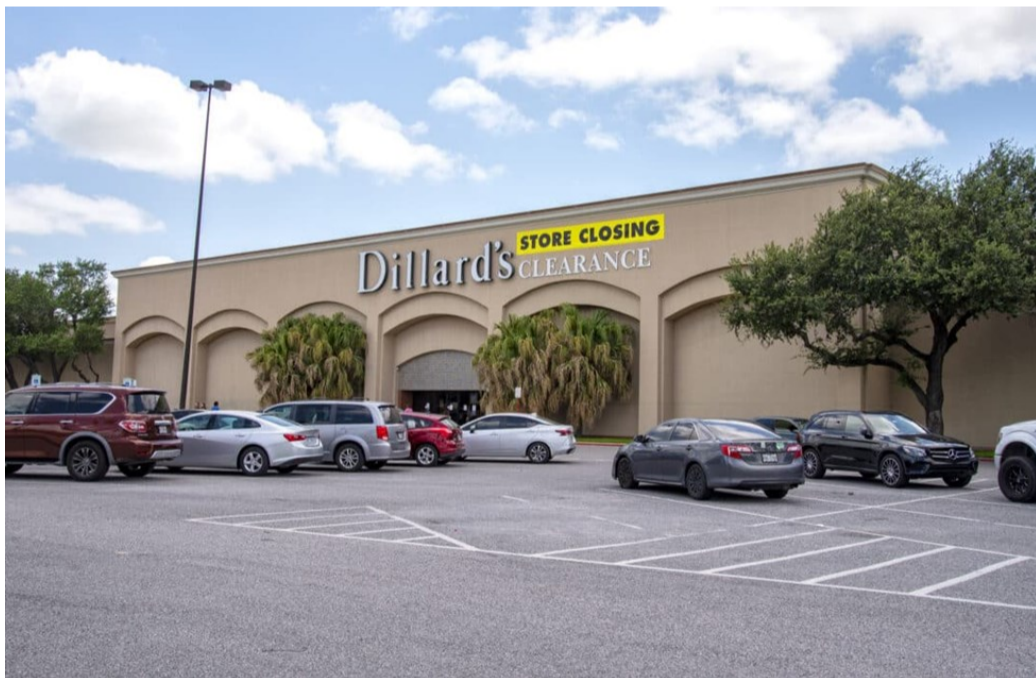
Anuncio del cierre de Dillard's en el centro comercial Valle Vista, en Harlingen (junio 2021)

Los shopping malls de Estados Unidos entraron en crisis hace unos 10-20 años, lo que ha llevado al cierre de muchas tiendas y, finalmente, al cierre de los malls mismos. Valle Vista entró en crisis en 2017, cuando ya acumulaba 19 espacios vacantes y cerró una de sus tiendas ancla, Forever 21 (ver Newsletter, núm.4/20 ), y se agravó en 2018 cuando cerró otra tienda ancla, Sears . Ante las crecientes pérdidas la empresa propietaria del mall, Washington Prime Group , con sede en Columbus, Ohio, decidió venderlo.