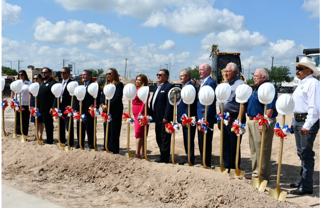
Inicio de las obras del centro comercial Rio Grande Village (junio 2021)

fetería ( Starbucks , el primero del condado) y una tienda de conveniencia con gasolinera ( Stripes ); y en una 2ª fase se construirá otro restaurante ( Buffalo Wings & Rings ) y un hotel (de la compañía Hilton Hotels & Resorts ).