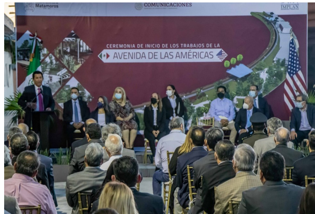
Ceremonia de inicio de las obras (agosto 2021)

del suelo para asegurar que los negocios que se instalen a los lados de la avenida y del parque lineal cumplan con un perfil socioeconómico y estético que atraiga visitantes de poder adquisitivo medio y alto.