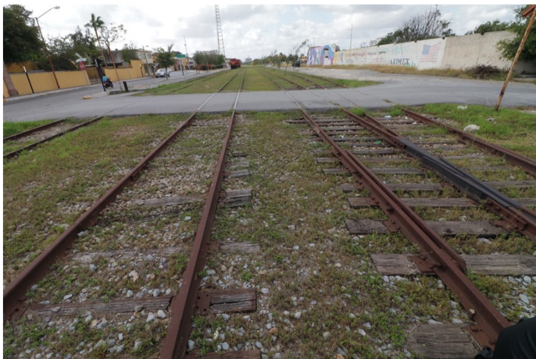
Vías del ferrocarril, donde se construirá la avenida de las Américas y el parque lineal

Finalmente en agosto se pusieron en marcha las obras, para las que se cuenta con una inversión de 118.2M de pesos: 108M a través del Fondo Nacional de Infraestructura (FONADIN) y 10.2M de Camino y Puentes Federales (CAPUFE). Las obras serán ejecutadas por 2 empresas y el propio Ayuntamiento de Matamoros , y se estima que concluyan en 1 año. En concreto, el 10 de agosto el personal del Ayuntamiento inició con la limpieza y desmonte de la hierba a lo largo de las vías del tren; y el 16 con la rehabilitación del pavimento de la calle Emilio Azcárraga.