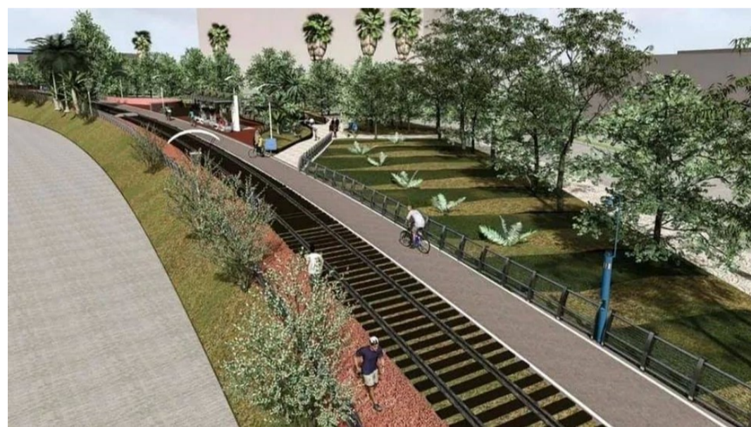
Proyección de la ciclovía y pista para correr

A nivel discursivo y simbólico, más que material, las autoridades locales de Matamoros presentan el CECUBI y las avenida de las Américas como un proyecto de carácter binacional y una muestra de la hermandad entre Matamoros y Brownsville.