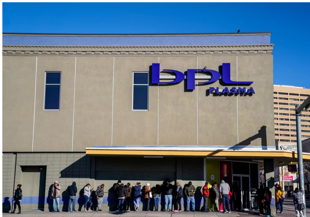
Fila de donantes en un centro de BPL Plasma en El Paso, TX (febrero 2020)

Los donantes mexicanos del Bajo Bravo con visa de turista (B2) y tarjeta de donante aprovecharon esta circunstancia para continuar cruzando a donar plasma. Para algunas familias la donación constituía una fuente de ingresos importante. Los medios de comunicación reportaron casos como el de dos familias de Matamoros que, en promedio, percibían al mes $920 dólares y $850 dólares respectivamente, ya que 2 de sus miembros acudían 2 veces por semana a donar. Asimismo, la CBP también detectó que muchas personas a quienes les permitía la entrada para donar, aprovechaban el cruce para realizar otras actividades (como para trabajar de forma irregular en la limpieza de casas o para realizar compras).