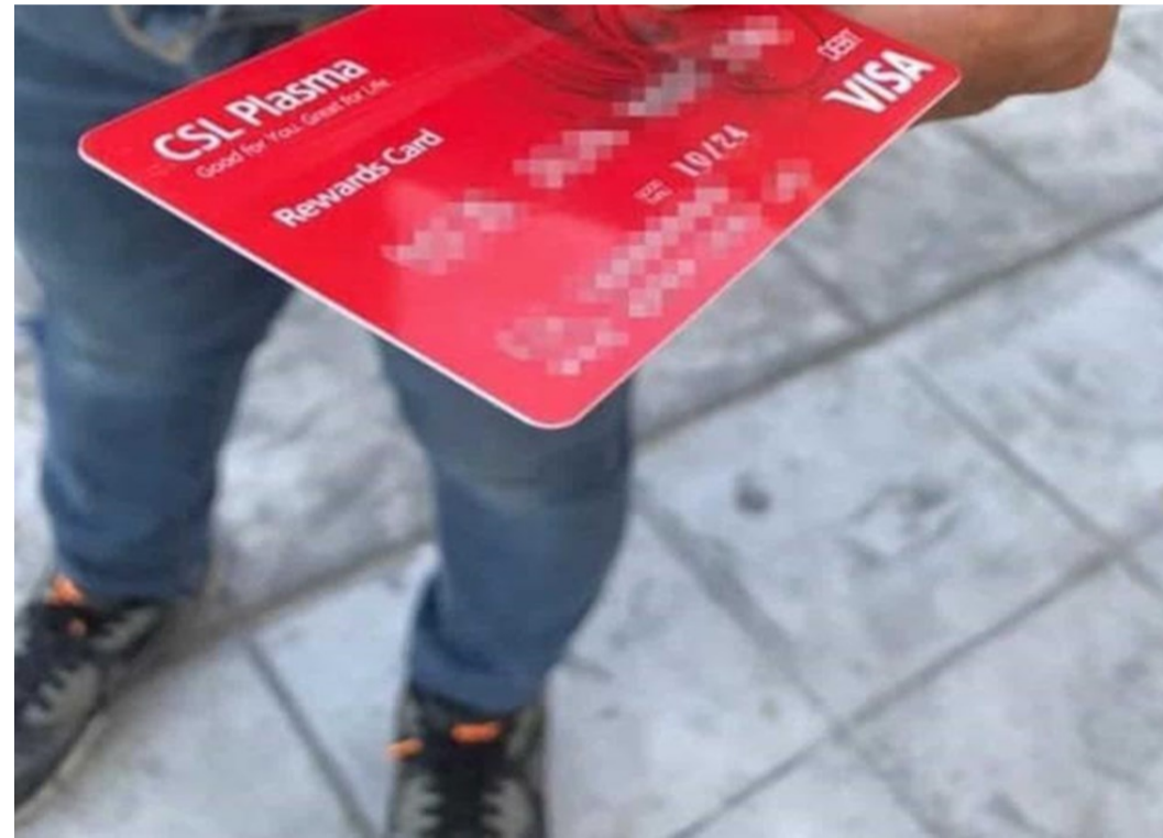
Tarjeta de donante (Reynosa, marzo 2020)

marzo 2020 y junio 2021) por los puertos de entrada de la frontera con México cruzaban 300-400 personas al día para donar plasma. Sin embargo, esta cantidad representa una disminución notable en comparación al volumen registrado antes de la pandemia, cuando cruzaban 800-1,000 personas diariamente.