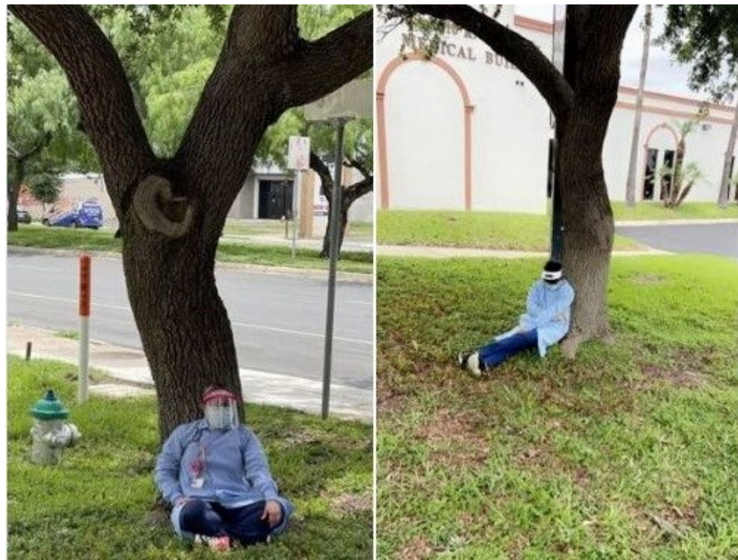
Post en facebook de Talecris en McAllen: "Han de estar aburridos sin tanta gente" (junio 2021)

zar, ya que se arriesgaban a que la CBP les retirara y cancelara la visa. Asimismo, en los días siguientes varios centros de donación reportaron nula actividad debido a la ausencia de donantes, como fue el caso del centro de Talecris Plasma Resources en McAllen.