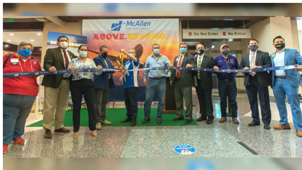
Inauguración del 1º vuelo McAllen-Monterrey en el aeropuerto de McAllen (abril 2021)

En marzo de 2021 se anunció la apertura de una ruta aérea entre los aeropuertos internacionales de McAllen y Monterrey, operada por Aeromar . El anuncio coincidió con el 8º aniversario de la ruta McAllen-Ciudad de México, operada por la misma aerolínea. La nueva ruta empezó el 22 de abril con 2 vuelos semanales en cada sentido (jueves y domingos), con una aeronave ATR 72-600 con capacidad para 72 pasajeros. El primer vuelo se inauguró en McAllen con un evento con temática de fútbol, debido al amor de México y Monterrey por este deporte, y contó con la presencia de las autoridades de la Ciudad de McAllen , del aeropuerto y de Aeromar.