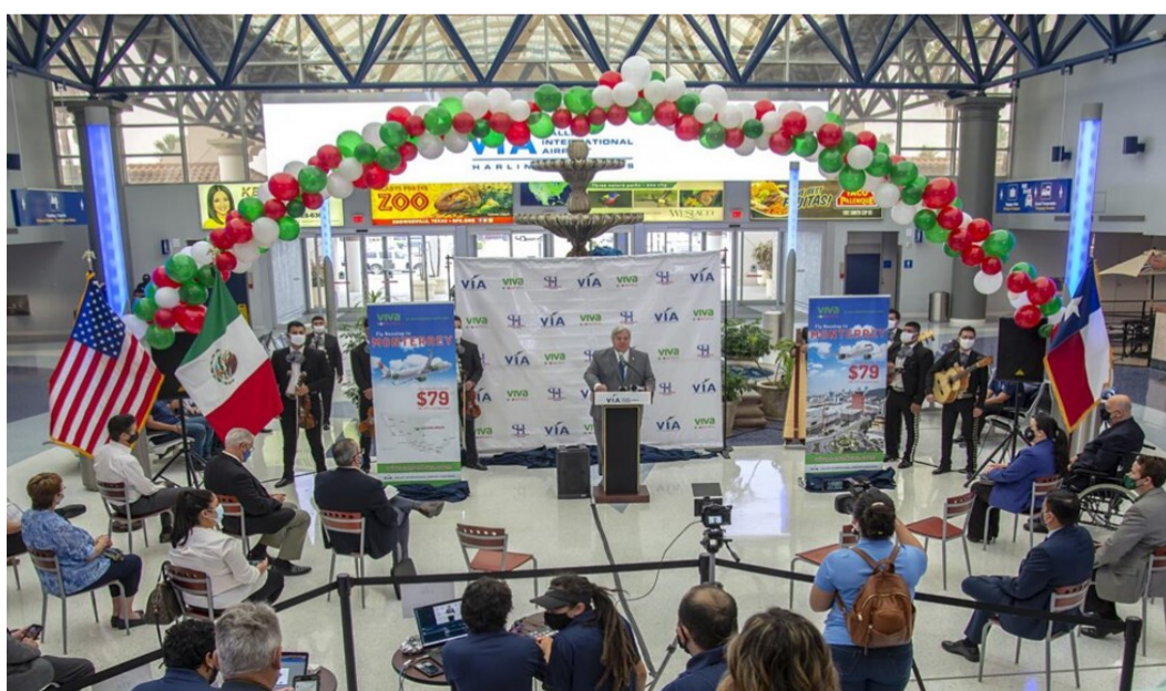
Anuncio de la nueva ruta Harlingen-Monterrey en el aeropuerto de Harlingen (abril 2021)

Para el establecimiento de esta nueva ruta primero fue necesario adecuar y mejorar las instalaciones del aeropuerto de Harlingen para la llegada y procesamiento de pasajeros internacionales. Según las regulaciones federales de Estados Unidos, el área de llegada internacional debe estar separada del área de pasajeros nacionales e incluir una estación de inspección federal (para la inspección migratoria y aduanal a cargo de la U.S. Customs and Border Protection , CBP). El costo total de renovación fue de unos $2 millones de dólares, presupuesto procedente en su mayoría de subvenciones del gobierno federal.