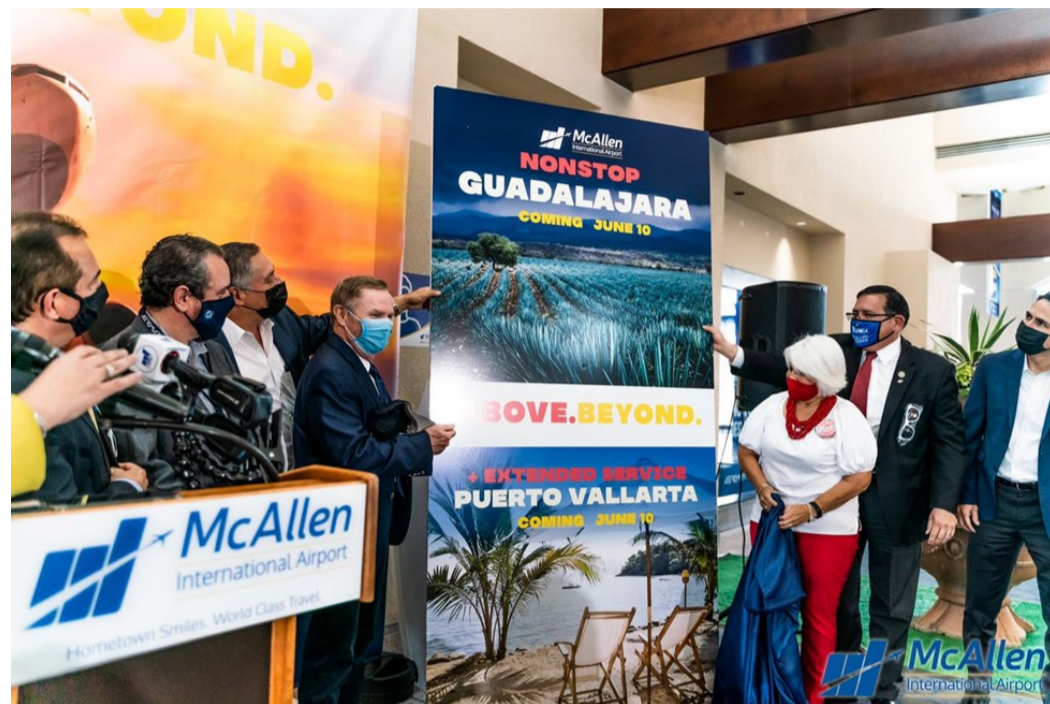
Anuncio de la apertura de las rutas de McAllen a Guadalajara y Puerto Vallarta (mayo 2021)

apertura de otras 2: McAllen-Guadalajara y McAllen-Puerto Vallarta, que empezaron a operar el 10 de junio, con 3 vuelos semanales (martes, jueves y sábados). Asimismo, se anunció que se estaba estudiando la posibilidad de agregar otros destinos de playa, como Acapulco.