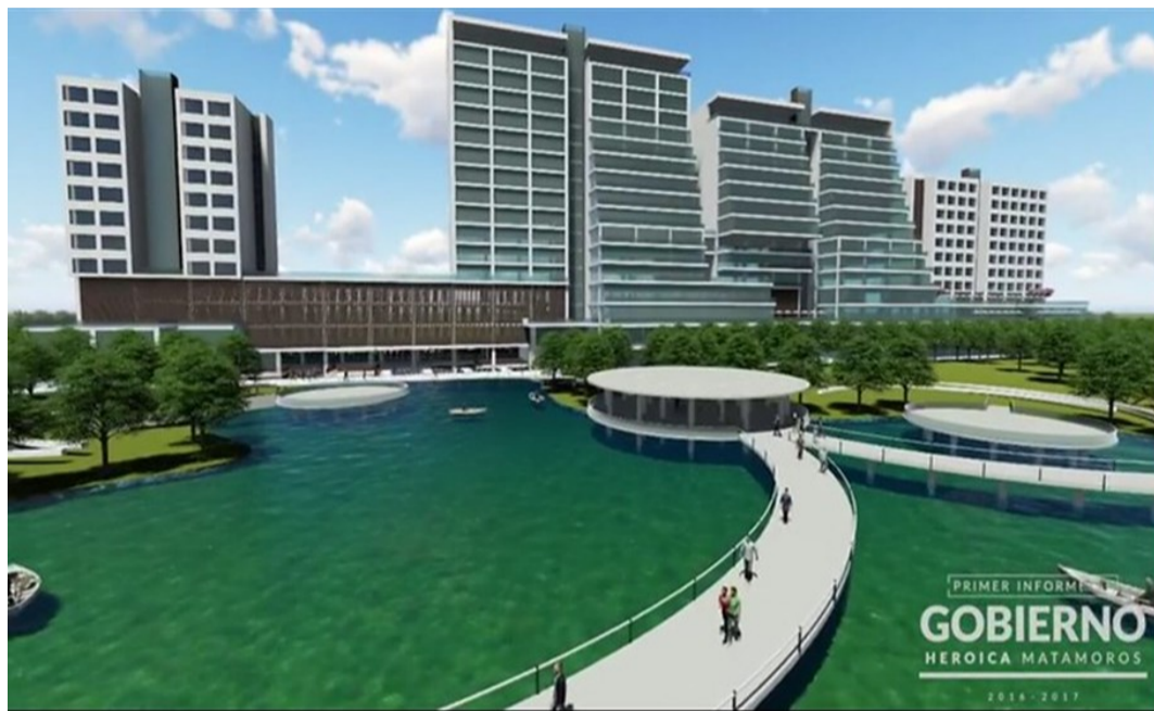
Proyección del Parque Central, junto al nuevo desarrollo comercial y residencial, de la Administración 2016-2018

otros edificios para uso comercial y un hotel. Un ejemplo de ello fue un Starbucks, inaugurado en febrero de 2018, construido en un lote baldío en frente del parque (ver Newsletter, núm.5/12 ).