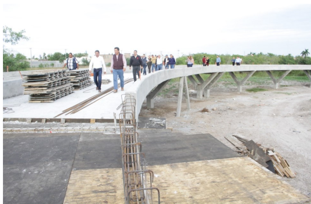
La ciclovía elevada en construcción: visita de obras por parte del gobierno local (noviembre 2018)