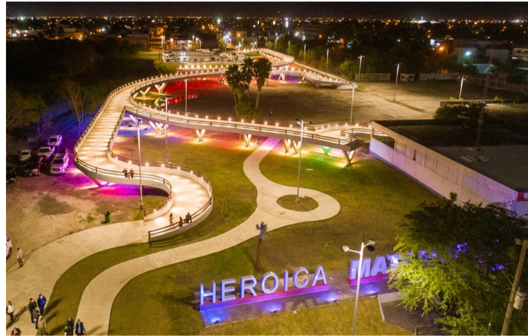
El Parque Central: 1ª etapa concluida (diciembre 2020)

2021 el gobierno local prevé solicitar al gobierno federal los recursos para la 2ª etapa del proyecto, que incluye la construcción de un anfiteatro y de un cruce peatonal sobre la avenida Pedro Cárdenas.