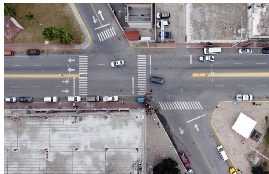
Intervención de urbanismo táctico: plaza de la República (antes) (octubre 2020)

Con el fin de dar un nuevo impulso a los propósitos establecidos en "Visión Reynosa 2030", 2 años después ONU Hábitat impulsó un proyecto de " Intervenciones de urbanismo táctico ", correspondiente al objetivo 5. El urbanismo táctico consiste en proyectos de urbanismo y gestión del espacio público mediante tácticas a pequeña escala, bajo una lógica experimental, gradual y de socialización constante. Este modelo ha ganado popularidad por sus ventajas sobre otros modelos: bajo costo, ágil implementación y participación de las comunidades a las que pretende servir.