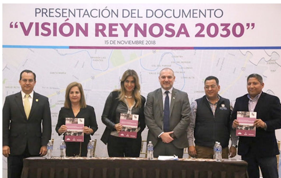
Presentación del documento Visión Reynosa 2030 (noviembre 2018)

Respondiendo a estos objetivos, en julio de 2018 se inició el proceso participativo "Visión Reynosa 2030", mediante 3 talleres coordinados por ONU Hábitat y el IMPLAN. En total, en el proceso participaron 45 entidades y unas 120 personas: expertos (nacionales e internacionales), representantes de los tres niveles de gobierno, de la sociedad civil y de las instituciones académicas. El documento final se presentó unos meses después, y contiene los principios y objetivos basados en el diagnóstico y en la NAU. Se fijan 10 objetivos estratégicos: 1/ Limitar la expansión urbana y aumentar la densidad; 2/ Favorecer la mezcla de usos y la actividad económica; 3/ Impulsar el acceso equitativo y asequible a los equipamientos y servicios básicos; 4/ Favorecer la movilidad sostenible; 5/ Recuperar el espacio público para el peatón; 6/ Fortalecer una política de viviendas habitables y asequibles para todos; 7/ Gestionar integral y eficientemente el ciclo del agua; 8/ Mejorar el medio ambiente; 9/ Reducir la inseguridad; y 10/ Mejorar las herramientas de implementación (instancias de coordinación metropolitana, ingresos municipales relacionados