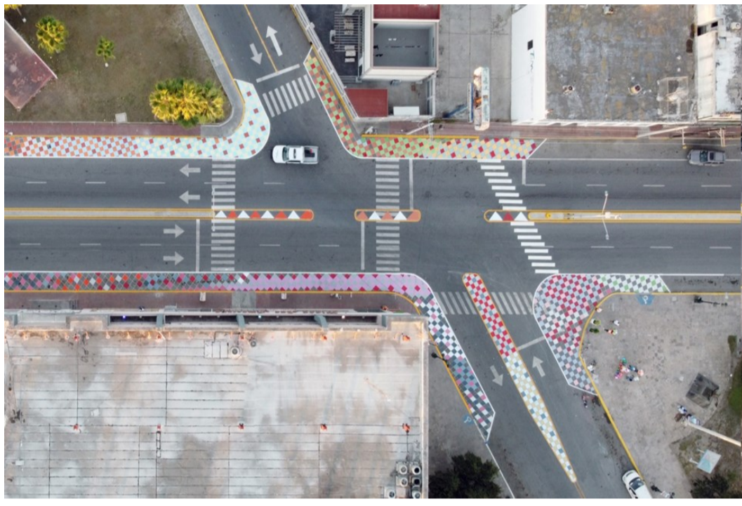
Intervención de urbanismo táctico: plaza de la República (después) (octubre 2020)

(pasos cebra, líneas, flechas direccionales y juegos). Estas acciones tienen un carácter temporal y durante unos meses el IMPLAN monitorea su impacto. En función de los resultados que se obtengan se decidirá implementar estas intervenciones de forma permanente y hacerlo también en otras colonias de la ciudad.