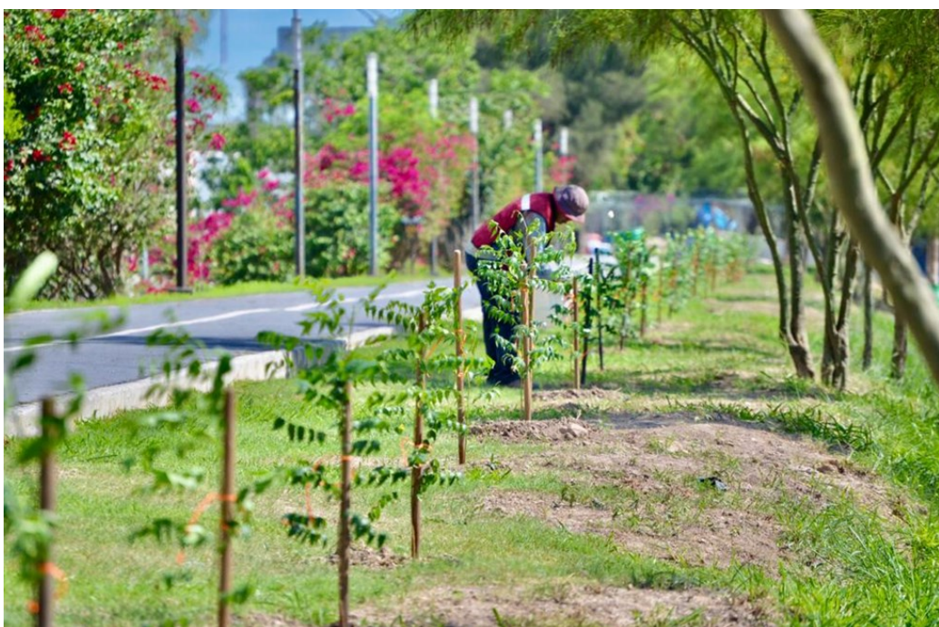
Arborización del bordo (Paseo del Río) (junio 2020)

Además de la arborización del Paseo del Río, en febrero de 2020 el gobierno local también anunció que la DEP plantaría árboles en otras áreas de la ciudad “para preservar el medio ambiente”. Así, en agosto se dio a conocer el programa municipal “Plantando mi futuro”, que tiene como propósito la “reforestación” de áreas verdes y mediante el cual la DEP se propone sembrar 11,000 arbolitos durante el año 2020. Los árboles son cultivados en el vivero municipal y corresponden a distintas especies adaptadas al clima de la región, como encinos, anacahuítas y ébanos. Además de la DEP, en el programa colaboran otras dependencias municipales (la Secretaría de Desarrollo y Bienestar Social , y la Comisión de Asentamientos Urbanos y Obras Públicas), además del apoyo puntual de distintas empresas industriales ( Albéa Cepillos de Matamoros , Kemet de México S.A. de C.V., TPI Composites, etc.). A mediados de noviembre se habían arborizado cerca de 25 áreas, con un promedio de 100 árboles por área, todas en colonias de la ciudad con la excepción de una en el ejido La Gloria.