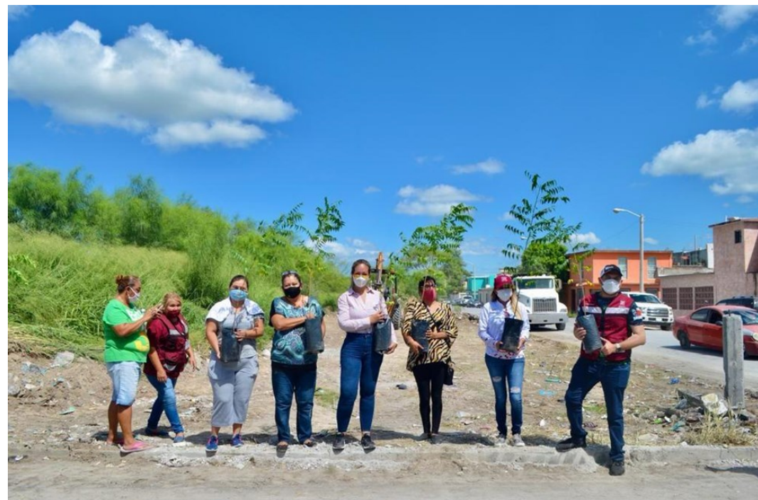
“Plantando mi futuro” en la colonia Casa Blanca (agosto 2020)