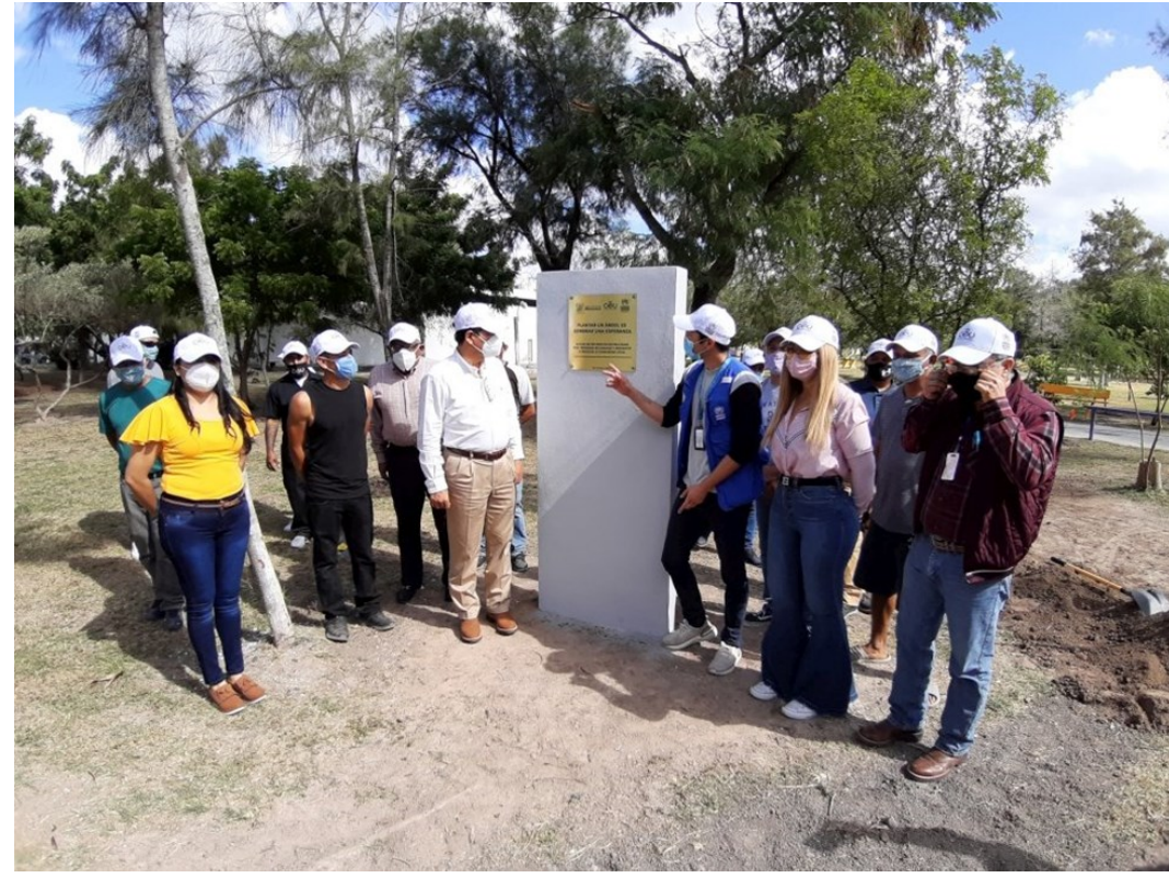
Colocación de la placa en el Chapoteadero (Unidad Deportiva “Emilio Martínez Manautou”) (noviembre 2020).

sembrar una esperanza. Acción de reforestación realizada por personas refugiadas y migrantes a favor de la comunidad local”.