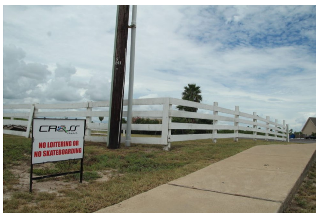
Letrero de Cross Church prohibiendo el skate en Gwen Bowl

La buena relación entre SPITS y la CHC se mantuvo sin problemas por varios años. Sin embargo en 2019 CHC transfirió la propiedad de la iglesia a Cross Church (CC), una entidad con sede en San Benito. En lo que respecta al parque, CC no reconoció como válido el acuerdo con SPITS, al no existir ningún documento y, a mediados de 2020 cerró unilateralmente el acceso al estacionamiento –desde el cual se accede al parque– y colocó letreros en la entrada prohibiendo el paso y el skate.