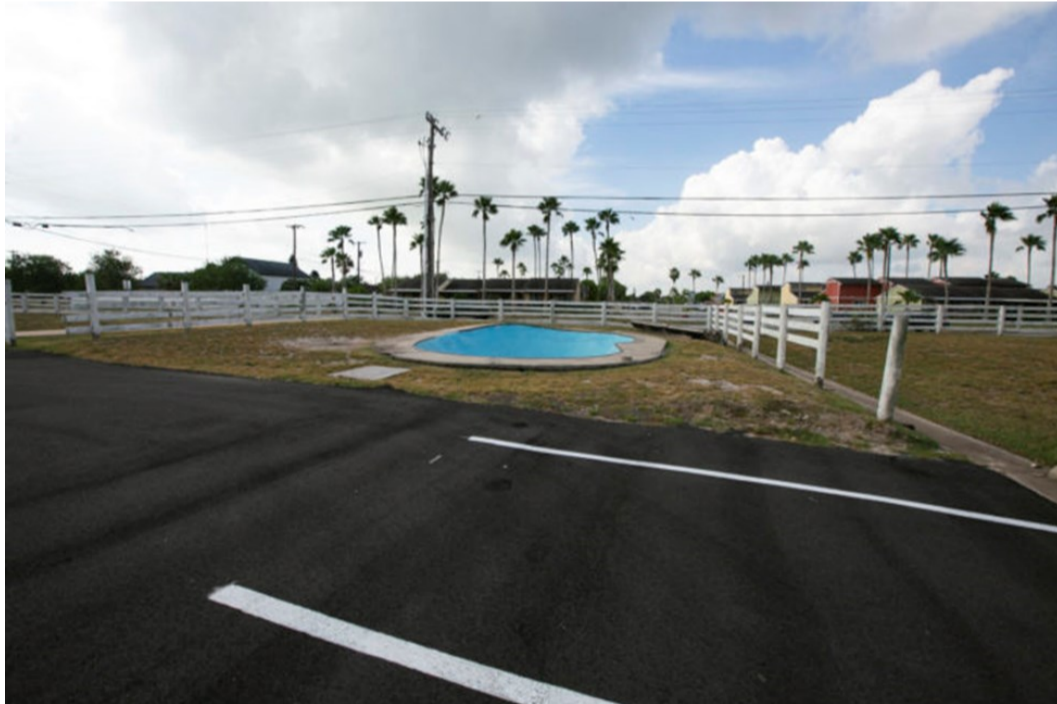
El parque Gwen Bowl, adyacente al estacionamiento de la iglesia Cross Church

Se trata de un skatepark de tipo bowl (cuenco), modelado según el estilo de patinaje de California de los años 1980; es decir, con paredes curvas para el patinaje vertical, sin necesidad de impulsarse con el pie. El parque, cuyo cuenco de color azul tiene forma de riñón, se localiza en una pequeña porción de terreno, adyacente al estacionamiento de una iglesia (originalmente Christ’s Harbour Church, desde 2019 Cross Church), en la localidad de Laguna Vista.