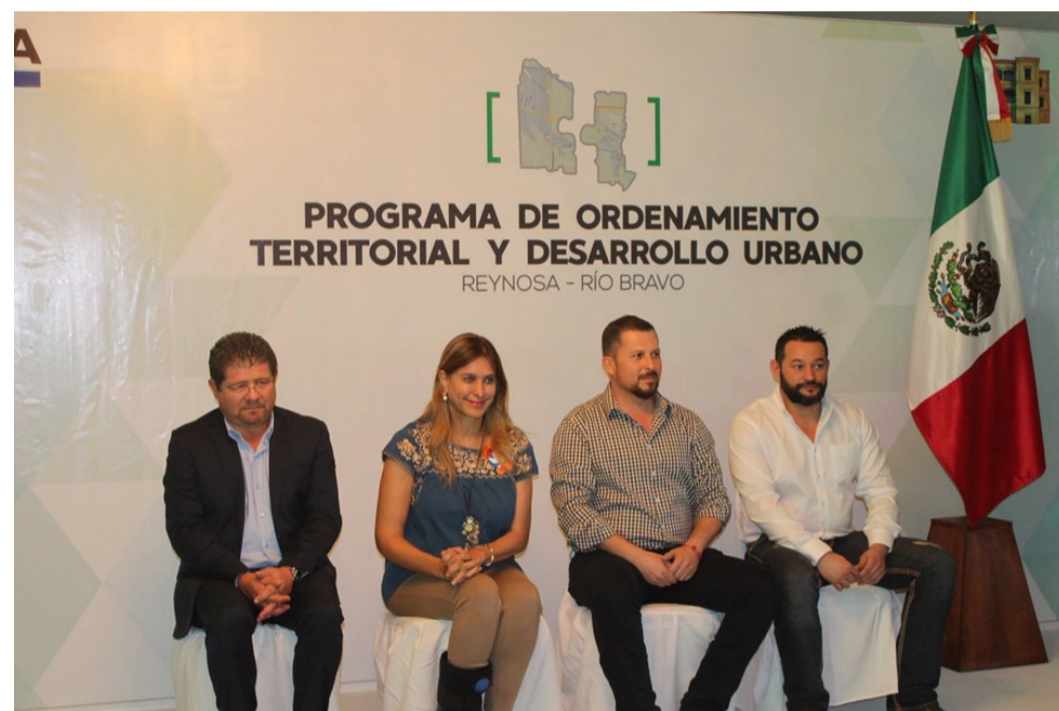
Presentación del POTDU Reynosa-Río Bravo (noviembre 2017)

proceso, en noviembre de 2017, los ayuntamientos de Reynosa y Río Bravo firmaron un acuerdo para la creación de un POTDU para la zona metropolitana, que a efectos prácticos implicaba, en primer lugar, la adecuación de los respectivos reglamentos municipales (los de Construcción, Imagen Urbana, Protección Civil, Desarrollo Urbano, Movilidad y Atlas de Riesgo, entre otros). Para afianzar estas acciones, el gobierno federal asignó un presupuesto de 14,900,000 pesos.