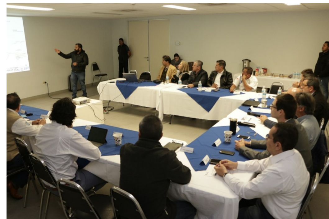
Presentación de los avances del PIMUS Reynosa-Río Bravo (febrero 2020)

Inspirado también en la nueva ley, en agosto de 2018 la SEDUMA de Tamaulipas inició la elaboración del Plan Integral de Movilidad Urbana Sustentable (PIMUS) de Reynosa-Río Bravo, cuyos avances se presentaron en febrero de 2020. El objetivo consiste en la programación de obras para mejorar la conectividad y movilidad urbana entre ambos municipios, y a financiarse a través del Fondo Nacional de Infraestructura (FONADIN) y del Banco Nacional de Obras y Servicios Públicos (BANOBAS).