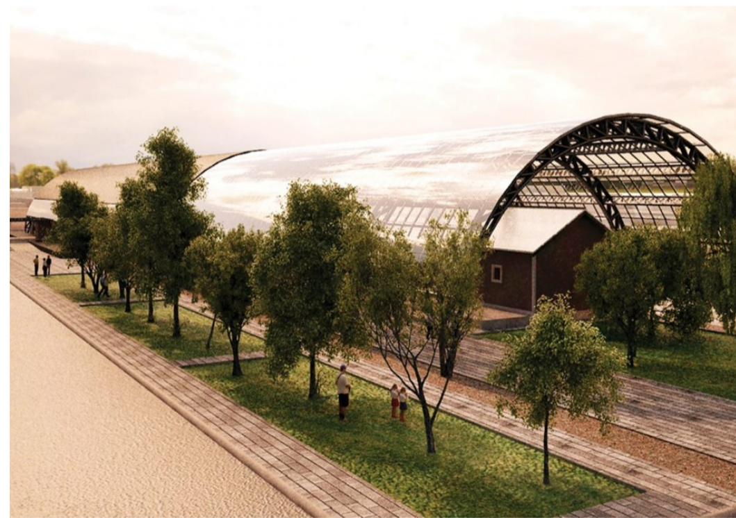
Proyecto "Bóveda" (mayo 2018)

La primera acción fue la convocatoria de un concurso de propuestas, que en mayo de 2018 se presentaron y exhibieron públicamente. Mediante una consulta ciudadana se escogió el mejor anteproyecto en cuanto a funcionalidad y estética. El proyecto seleccionado, titulado "Bóveda", planteaba la habilitación de 500 m 2 de superficie útil distribuida en 2 plantas, una cubierta abovedada, sala de exposición permanente, salas de talleres, una ludoteca y cineteca, y área de administración. A pesar de la difusión y entusiasmo con el que se presentó el proyecto, el Ayuntamiento no concretó ni el calendario de obras ni la disponibilidad de financiamiento (que se calculaba en unos 15M de pesos) y quedó aparcado a causa de la campaña para las elecciones municipales.