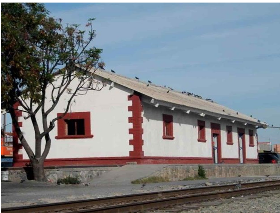
Antigua bodega ferroviaria de Reynosa

La estación se construyó en lo que, a finales del s.XIX, era el límite sur de Reynosa, y quedaba conectada a la Plaza Principal, a 6 cuadras, a través de la calle Hidalgo. Las instalaciones, propiedad de la empresa ferroviaria Kansas City Southern de México (KCSM), estaban integradas por 2 edificios: la estación propiamente dicha y una bodega. En suspenderse el servicio de pasajeros, en 1997, la estación se demolió y en su lugar se habilitó una explanada utilizada como estacionamiento; la bodega, por el contrario, se mantuvo pero se fue degradando. Anexo a estas instalaciones se localizan otros equipamientos, en especial 2 mercados contiguos, uno a cada lado: Guadalupeano y Fidel Velázquez, que actualmente también presentan un elevado deterioro, abandono de locales y escasos clientes (ver Newsletter, núm.4/09 ).