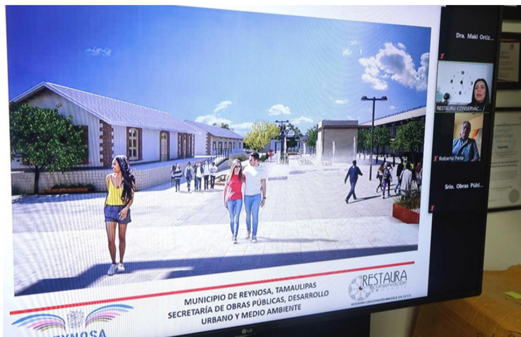
Proyección del Museo del Ferrocarril, con la restauración de la bodega y construcción de una réplica de la estación (julio 2020)

A pesar de todo, se mantenían algunas inconformidades. Por ello, el proyecto se revisó de nuevo, proceso en el que participaron el Instituto Nacional de Antropología e Historia (INAH), el Instituto Nacional de Bellas Artes (INBA) y el Museo Nacional de los Ferrocarriles Mexicanos , junto a la empresa Restaura Conservación Inmuebles SA de CV, de Ciudad de México. El nuevo diseño se presentó en junio de 2020 y se presupuestó en