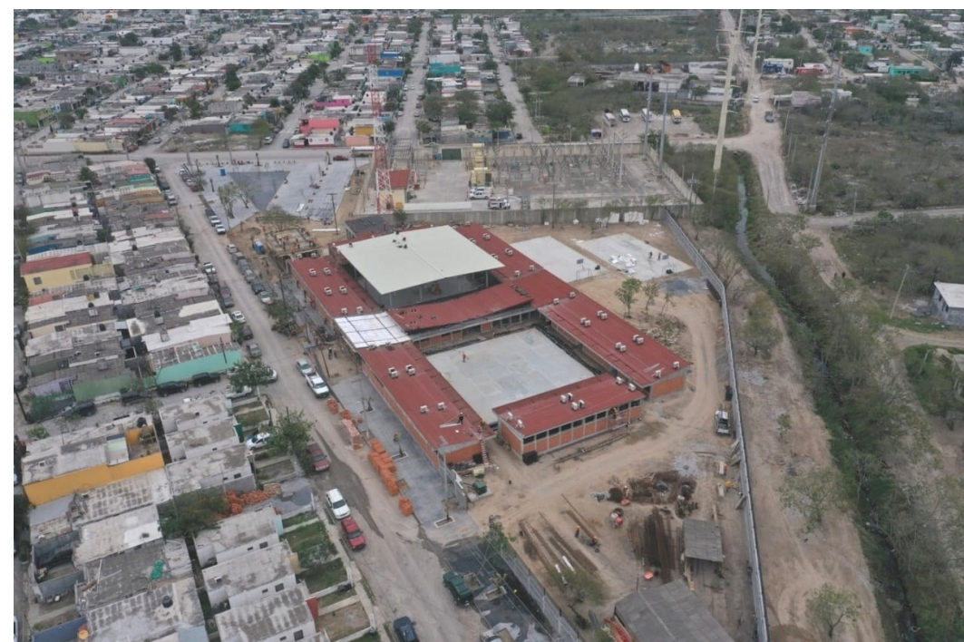
Escuela secundaria construida en la colonia Lomas de San Juan (mayo 2020)