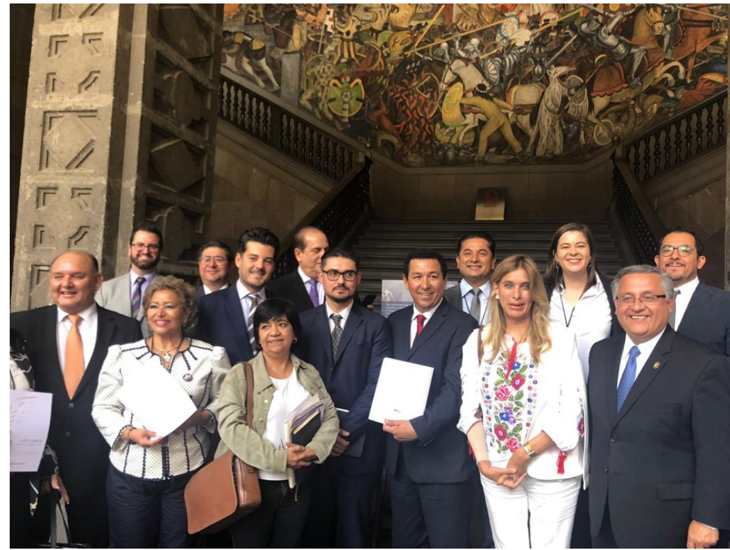
Firma del convenio entre la SEDATU y los ayuntamientos de la primera fase del PMU para la ejecución del subprograma de Mejora Integral de Barrios, en el Palacio Nacional, en Ciudad de México (julio 2019)

E n enero de 2019 la actual administración federal de México (2018-2024) presentó uno de sus programas estrella, el Programa de Mejoramiento Urbano “Mi México Late” (PMU), que dirige la Secretaría de Desarrollo Agrario, Territorial y Urbano (SEDATU) (ver Newsletter, núm.6/02 ). Tiene por objeto realizar acciones de mejora urbana en colonias de pobreza extrema en 100 municipios del país a lo largo del sexenio. El PMU inició en 15 ciudades (10 de las cuales en la Frontera Norte); posteriormente, se han ido añadiendo otras y en mayo de 2020 ya eran 26. Las acciones en las primeras ciudades ya se han (casi) concluido, aunque su ejecución no ha estado exenta de quejas por retrasos, incumplimientos y mala calidad, lo que ha llevado a protestas ciudadanas. El caso de Matamoros es ilustrativo.