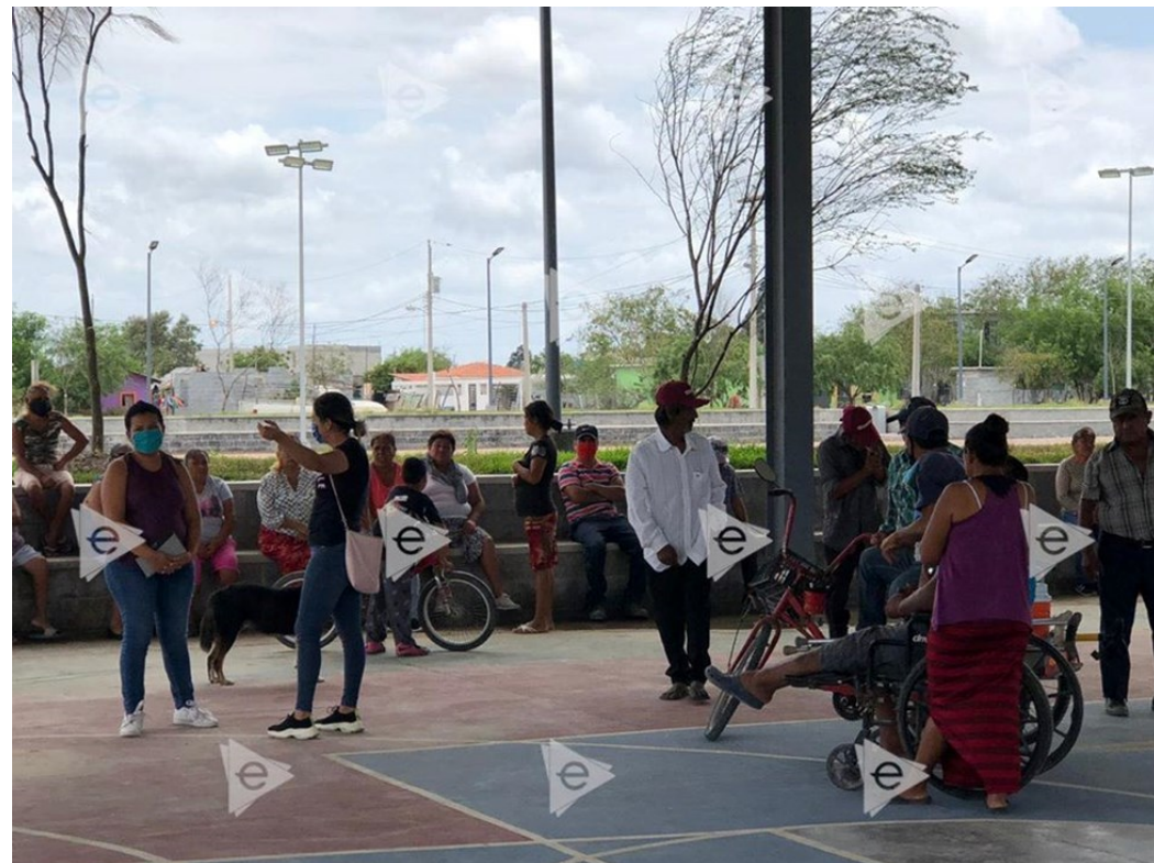
Protesta de los vecinos de las colonias Ampliación Santa María y del Alto (mayo 2020)

vivienda, en mayo solo se habían ejecutado 10 de los 41 apoyos previstos, dada la complejidad jurídica y técnica del proceso. De acuerdo al Ayuntamiento, las principales dificultades las presenta la colonia 2 de Agosto, la principal invasión de la ciudad, de cerca de 90 ha.