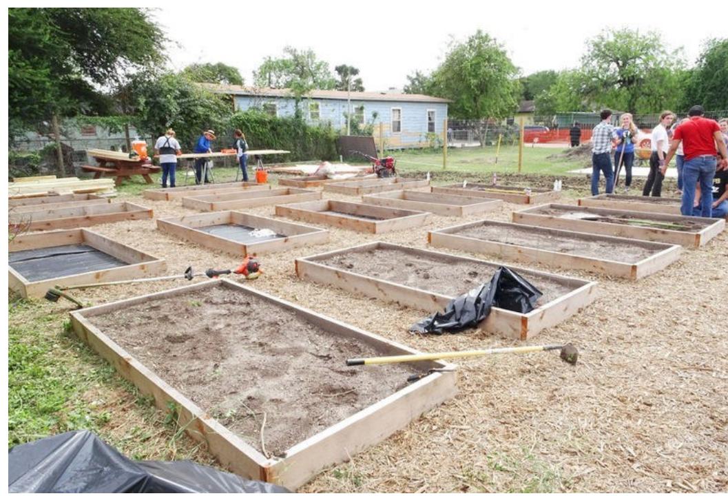
Construcción del huerto comunitario