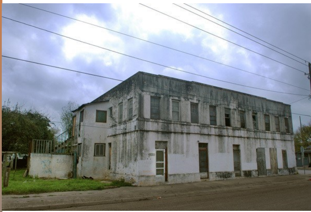
La Casa Rubio (antes de la demolición)

Con la demolición de la casa, en noviembre de 2016 la BWC inició la ampliación hacia el resto de la propiedad (en marzo de 2017 todavía no había concluido), tarea en la que colaboran estudiantes ( YouthBuild Brownsville ), el gobierno municipal y la Community Development Corporation of Brownsville . Además de nuevos lotes, se están añadiendo una zona de juegos infantiles, pérgolas y otros elementos para que el lugar sea más cómodo a la estancia de familias.