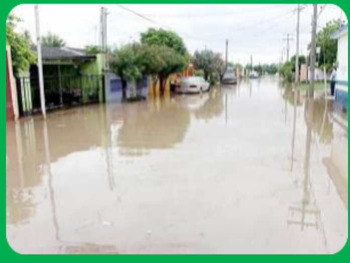
Calles inundadas en Camargo

En esta dirección, el 25 de mayo, el Gobernador de Texas, Greg Abbot, declaró el Estado de Emergencia para 24 condados del estado, incluido el de Hidalgo. Esta declaratoria implica que un equipo estatal evaluará los daños y calculará los fondos estatales que se recibirán. Días después, el 5 de junio, la FEMA incluyó también el condado en la Declaratoria de Desastre , lo que permitirá a la población afectada –que no esté cubierta por un seguro– aplicar para reembolsos.