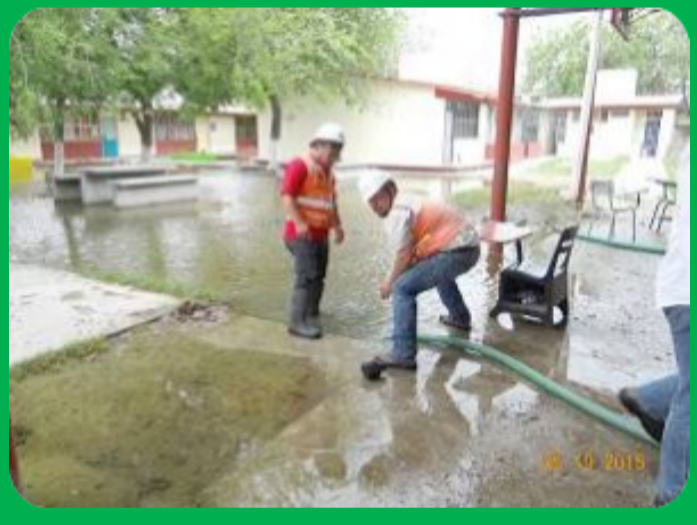
Bombeo de agua en Reynosa