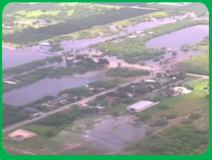
Inundación en el Condado de Hidalgo